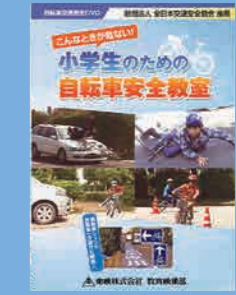
小学生向け (17分) 貸出 No.007

サカカちゃんの夢の中にピカピカの新しい自転車が見えます。自転車はいつまでも仲良しであるために、正しい例と悪い例を示しながら自転車の交通ルールを説明していきます。