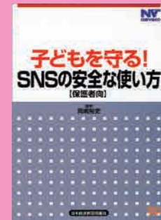
保護者向け (20分) 貸出 No.013

個人情報の漏洩を防ぐために行ってほしい対策を紹介します。また、個人情報が流出するとどうなるか？実例と対策をわかりやすく説明します。