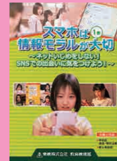
中学生～一般向け (20分) 貸出 No.027

スマホ依存の問題を自覚し対策をすることは大切で、この作品はそのきっかけになります。スマホ依存の特徴について、使用する時間の長さだけでなく、日ごろ気づきにくい行動にも触れています。また、対策法はシンプルながらも何に気を付けるべきか、そのポイントを自覚できます。親がスマホ依存であると、子供もなりやすいという指摘もあります。親自身がスマホ依存を考えてみるためにも、話し合いのきっかけにPTAの皆さんで視聴してみるのはいかがでしょうか。