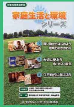
中学生～一般向け (30分) 貸出 No.002

これからはPTA活動でもSDGsを意識したものが求められてくると考えます。例えば親子活動・親子学習などでもSDGsを考える活動をしてみるのも良いのではないのでしょうか。役員会での研修などにも活用できます。