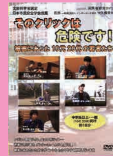
中学生～一般向け (18分) 貸出 No.008

スマホやパソコンなどでのネット利用時に、架空請求詐欺や個人情報の漏えいなど、犯罪被害に遭わないためのポイントや、SNSに書き込みをする際のルールについて取り上げていきます。