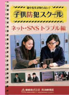
中学生～一般向け (20分) 貸出 No.020

アダルト情報サイト・出会い系サイトなど、悪質サイトの被害にあわないためのポイントについて、代表的な事例を見せながら、その予防法と対処法をわかりやすく説明しています。