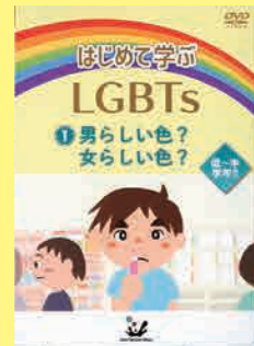
小学生向け (20分) 貸出 No.028

「性のありかた」はとても多様で、全ての人々にかかわりがあります。性のありかたや多様性についての基礎知識をわかりやすく解説します。また、インタビューを通して性的マイノリティの方を取り巻く実情について伝えます。性の多様性だけでなく、みんなが尊重され誰もが過ごしやすい社会や学校について考えていける作品です。