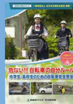
小学生高学年・中学生・一般向け (17分) 貸出 No.032