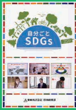
小学生・中学生・保護者 (20分) 貸出 No.031

SDGsとは何かをわかりやすく説明。大きなことではなく自分の身近にできることが多いことを意識できます。また、ペットボトルリサイクルやプラスチックごみの問題を例にSDGsに取り組んでいる人たちのインタビューを見て、身の回りにあるものからSDGsについての考えを深めていきます。