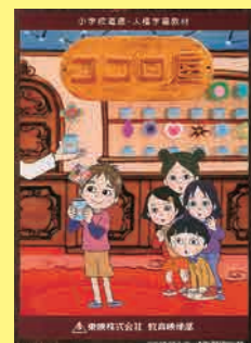
小学生向け (25分) 貸出 No.026

ドラマ形式の教材です。傍観者がいかにして「いじめの構図」を崩せるかという視点を中心に、クラス全体で話し合うために活用できる作品です。