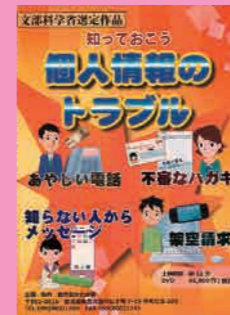
中学生～一般向け (12分) 貸出 No.017

「ネットいじめ」「SNSでの出会い」の二つのテーマを取り上げ、それぞれドラマ編と解説編で構成。この場面で自分だったらどうするか、自分ごととして考えながら学ぶことができます。