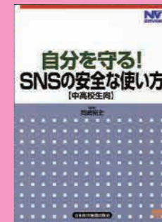
中学生～一般向け (22分) 貸出 No.012