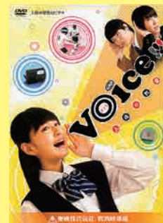
小学生～一般向け (38分) 貸出 No.022

「今まで命を大切に生きてきたのか」震災によって多くを失った人々の声を紹介しながら、私たちの今を振り返り、震災後のこれからをどう生きるかを共に考える「いのちの教育」教材です。