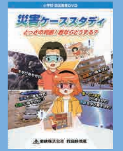
小学生～一般向け (10分×5) 貸出 No.014