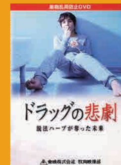
中学生～一般向け (19分) 貸出 No.009

脱法ドラッグの恐ろしさを実感させ、拒絶する強い意志と危機意識を持たせます。再現シーンと解説シーンで構成し、薬物を拒絶する強い意志をもたせます。