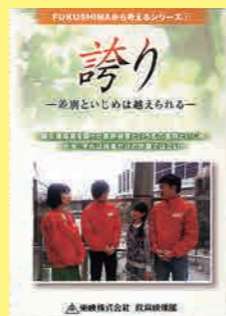
中学生～一般向け (30分) 貸出 No.025

虐待は暴力だけではありません。日常的な不適切な子育ても虐待になります。子育ての中で起こりがちな問題点を示し、虐待を防ぐために私たちができることを描いていきます。