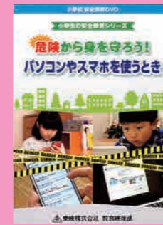
小学生向け (16分) 貸出 No.010

SNSとは何ですか？保護者が知っておくべきこと、家庭でのルール作りなど、実例を含めて説明します。 (主な内容) ・SNSとは ・保護者の知っておくべきこと