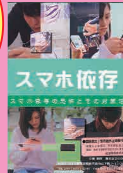
主な内容 ・スマホ依存の特徴 ・スマホ依存の原因 ・スマホ依存を治す 小学生高学年・中学生・一般向け (12分) 貸出 No.021

スマホ依存の問題を自覚し対策をすることは大切で、この作品はそのきっかけになります。スマホ依存の特徴について、使用する時間の長さだけでなく、日ごろ気づきにくい行動にも触れています。また、対策法はシンプルながらも何に気を付けるべきか、そのポイントを自覚できます。親がスマホ依存であると、子供もなりやすいという指摘もあります。親自身がスマホ依存を考えてみるためにも、話し合いのきっかけにPTAの皆さんで視聴してみるのはいかがでしょうか。