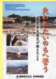
小学生～一般向け (20分) 貸出 No.003

ドラマ形式の教材です。同性を好きになった児童のドラマを通して、一人一人の個性として肯定的にとらえることを考えます。また当事者児童の自己肯定感が阻害されることなく勇気づけられ、自尊感情を育めるよう配慮されています。