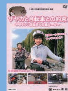
小学生向け (18分) 貸出 No.015

自転車の交通違反のポイントや、交差点などの危険個所における通行上の安全確保の仕方を丁寧に説明しています。また、事故や違反を起こしたときにどうなるかについても解説しています。