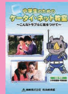
小学生向け (30分) 貸出 No.004

ネットやSNSのトラブルから子供達を守るにはどうしたらいいのでしょうか？専門家の先生がわかりやすく解説します。学校の授業や保護者会などの学習に最適です。