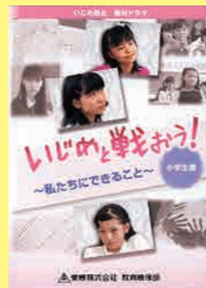
小学生向け (21分) 貸出 No.023

ドラマ形式の教材です。いじめの傍観者であれば加害者ではないのか？中学生が意見を語り合いながら、クラスに観衆や傍観者が生まれることで、いじめが大きくなってしまふ様子を考えます。