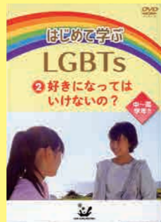
小学生高学年・中学生向け (22分) 貸出 No.029

「LGBTs」、個性の理解に関する低学年向け教材です。アニメーションにより描かれた色鉛筆と人間との物語を通して、自分らしくあることの素晴らしさ、他者を尊重する姿勢を考えながら、多様性を学んでいきます。