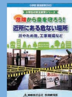
小学生～一般向け (12分) 貸出 No.011

通学路点検前の研修会に最適です。河川、用水路、ため池、工事現場を取り上げ、事故の危険を具体的に分かりやすく伝えます。