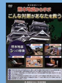
保護者向け (26分) 貸出 No.018

いつ、どこで起こるか分からない大地震。アニメ番組でもおなじみ「ズッコケ三人組」のキャラクターとともに、「地震が起きた時の命を守る行動」「被害を未然に防ぐための工夫」など地震が起きた時の基本的な防災知識と行動を身につける教材です。