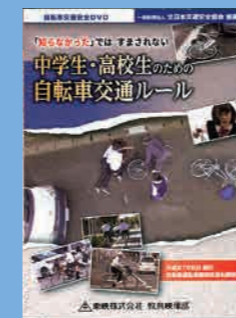
小学生高学年・中学生・一般向け (19分) 貸出 No.016

自転車の交通違反のポイントや、交差点などの危険個所における通行上の安全確保の仕方を丁寧に説明しています。また、事故や違反を起こしたときにどうなるかについても解説しています。