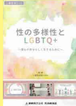
小学生高学年・中学生・保護者向け (25分) 貸出 No.33

ドラマ形式の教材です。主人公のクラスに転校してきた日系ブラジル人のニコラスは、すぐにみんなと仲良くなりますが、徐々にクラスの中で浮いた存在に。ある日クラスメイトとケンカになってしまいます。お互いの文化の違いを知り誤解を解いていくことで、国際理解だけでなく、お互いの立場や考えを大事にする心の教育にも最適な道徳教材です。