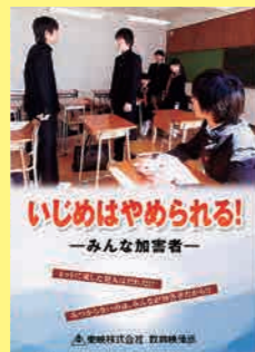
小学生高学年・中学生向け (17分) 貸出 No.006

舞台は、休日の学校で開かれる「人権の教室」。「オリンピックパラリンピックと人権」など3つの人権のテーマについて学んでいきます。