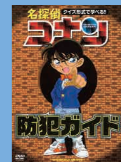
小学生向け (26分) 貸出 No.001

犯罪から守るために、コナンと仲間たちがQ&Aクイズ形式で身近に潜む「危険」をわかりやすく解説します。