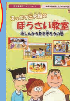
小学生向け (14分) 貸出 No.019

ドライブレコーダーの事故映像や加害者になった時の再現映像を通して、自転車事故の怖さを伝えていきます。自転車事故の被害者にも加害者にもならないために、自転車を運転する時のルールやマナーを基本から紹介していきます。