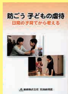
保護者向け (25分) 貸出 No.024

アニメーション作品。ウツロイ博士が作り出した「ココロ」をテーマに、自分とは何かを考えます。いじめや差別をしよう心を考える小学生向けの道徳教材に最適です。